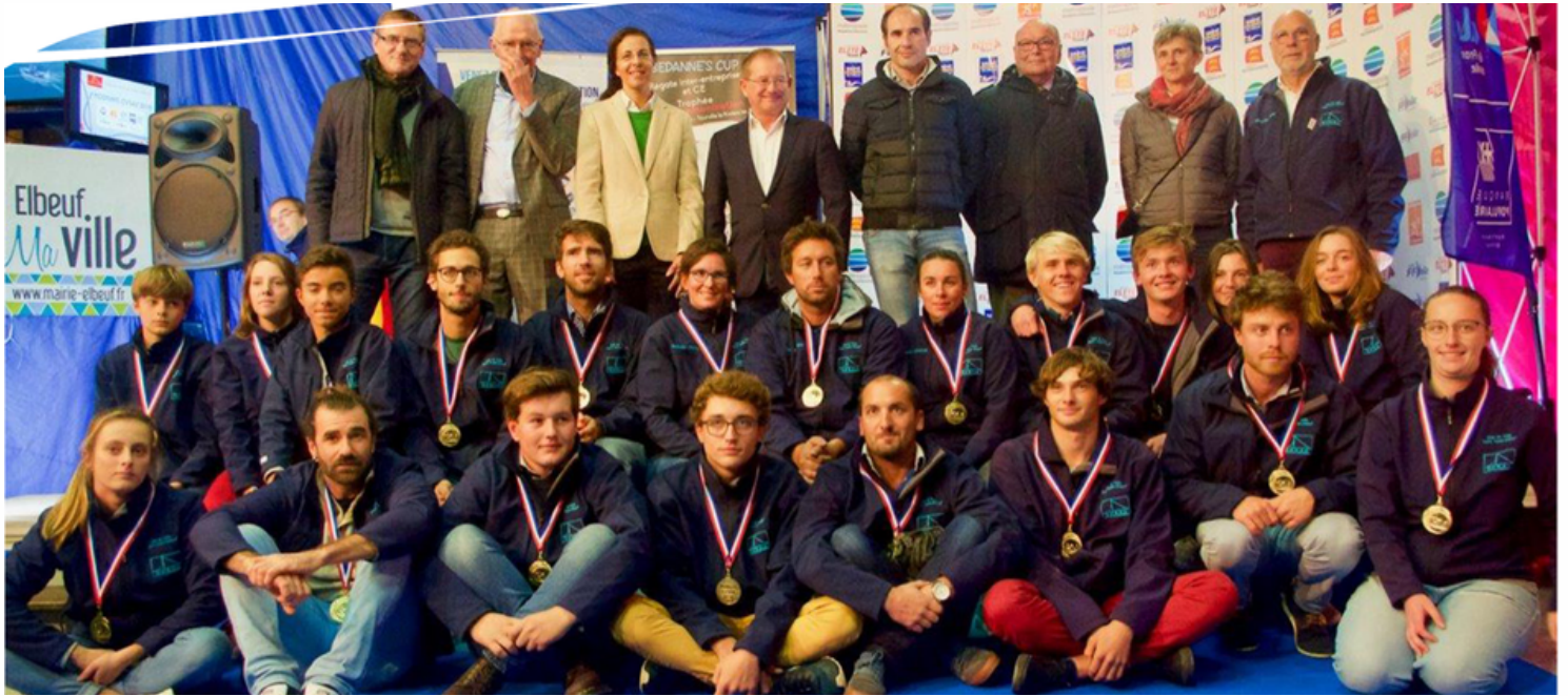
24 sportifs de niveau national ou international médaillés en 2018

Fondé en 1975, le CVSAE s'est fortement développé en devenant gestionnaire de la base de loisirs de Bédanne, par délégation de service public de la Métropole Rouen-Normandie.